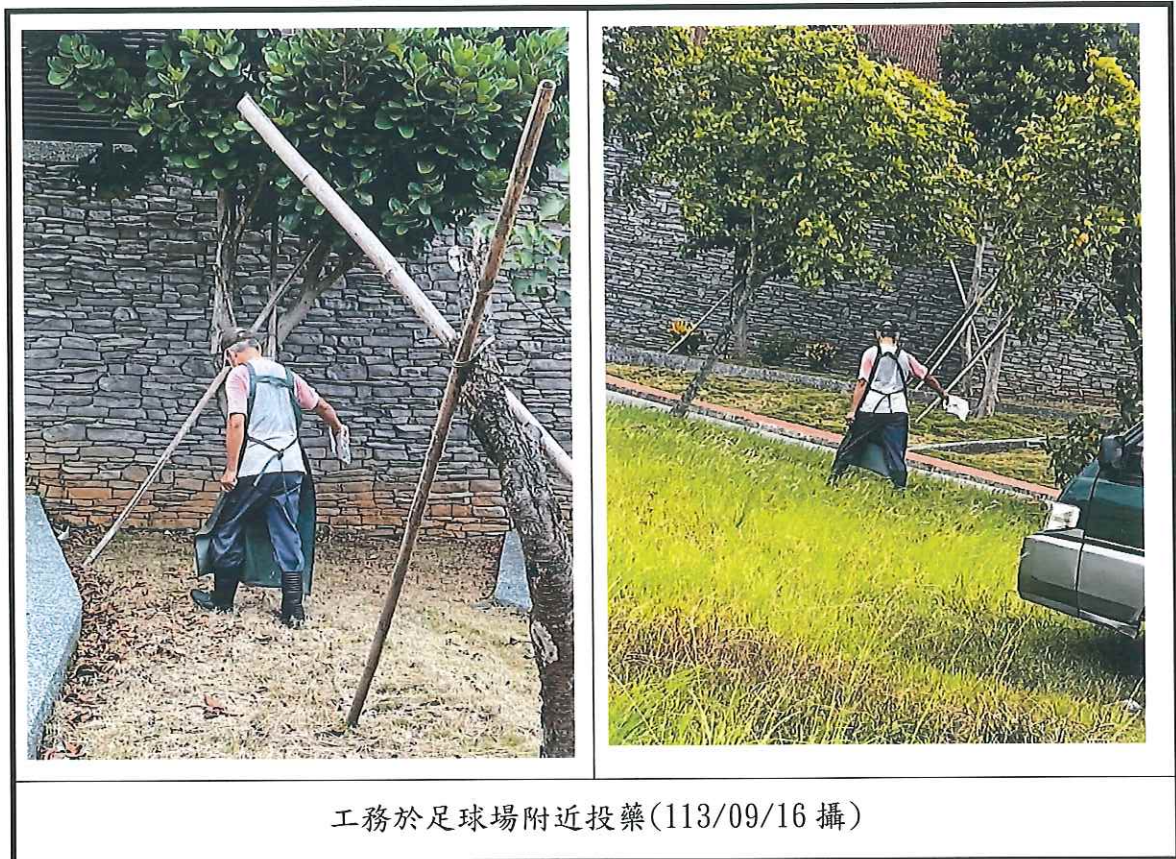
工務於足球場附近投藥(113/09/16 攝)