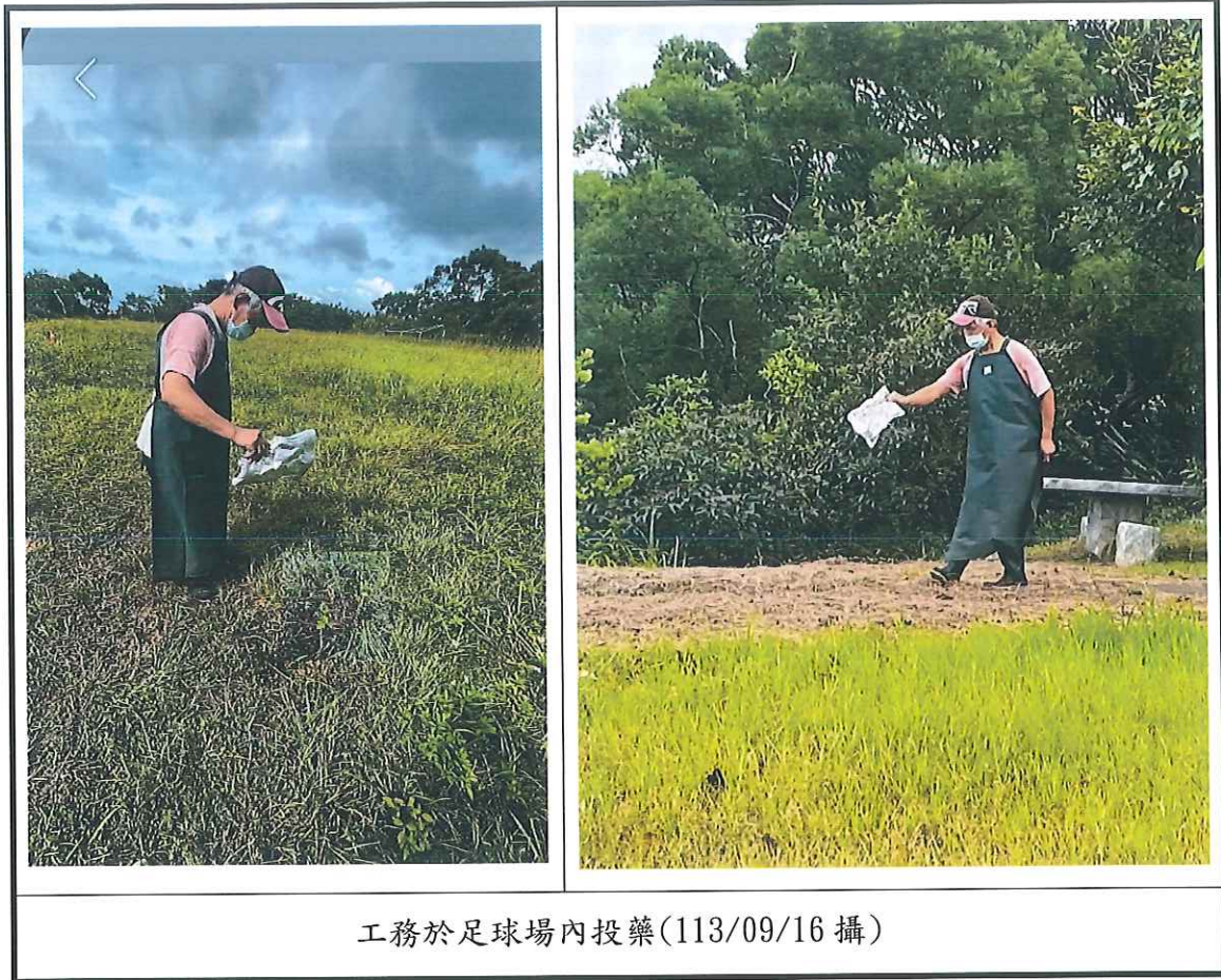
工務於足球場內投藥(113/09/16 攝)