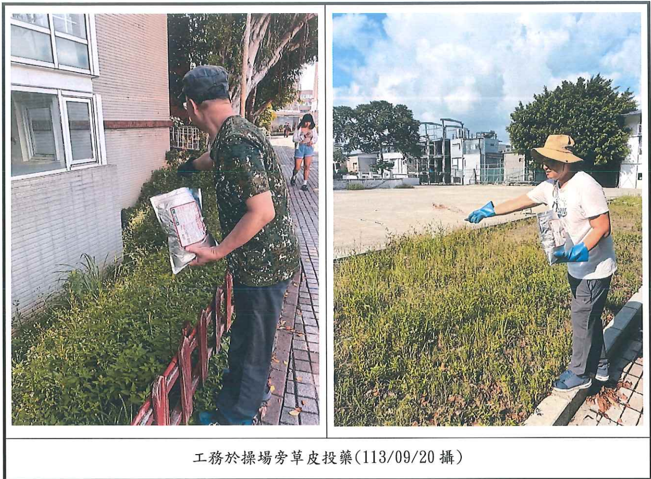
工務於操場旁草皮投藥(113/09/20 攝)