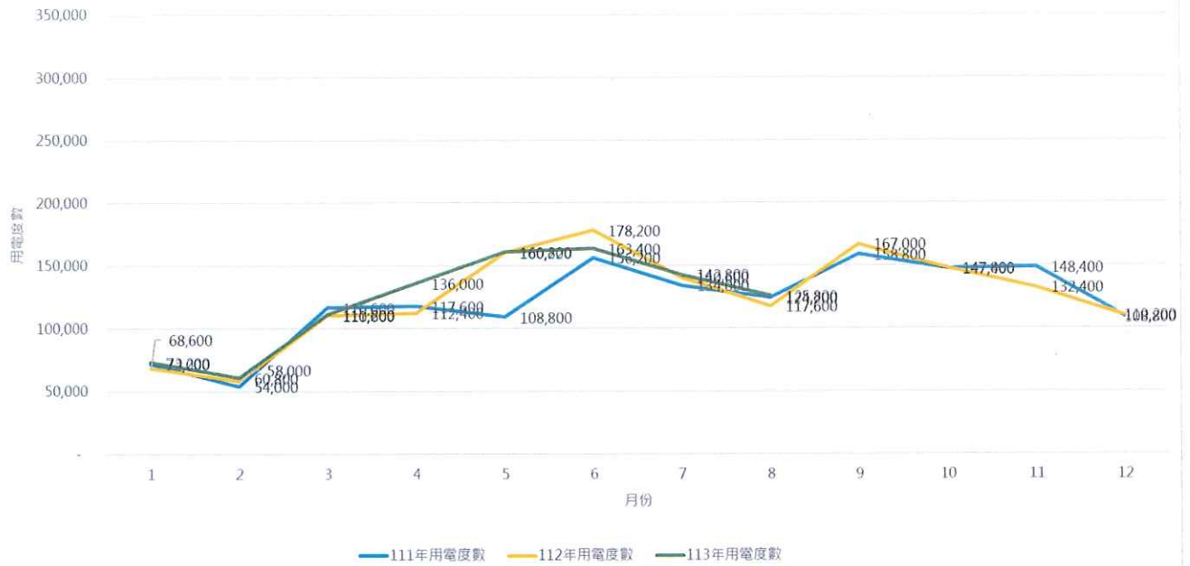
關渡校園用電度數